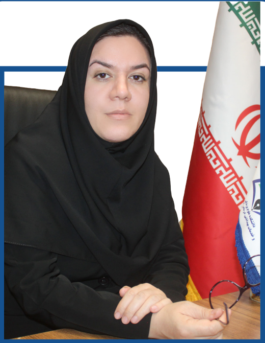
رئیس دانشکده علوم پزشکی اسدآباد خیرداد:

اخذ مجوز موافقت اصولی ساخت بیمارستان ۱۲۸ تخت خوابی امیرالمومنین (ع)، فعالیت ۳۳ پزشک متخصص در کادر درمانی