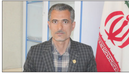
کارگزار بیمه بخش پیرسلمان خیرداد: پرداخت مستمری بازنشستگی به بیش از ۱۱۰ نفر از بیمه شدگان بخش پیرسلمان