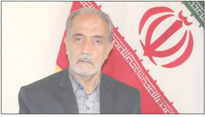
رئیس موسسه خیریه دارالیتام صاحب الزمان (عج) اسدآباد خیر داد توزیع ۱۶۰۰ بسته معیشتی توزیع ۲۵۰۰ هزار بسته نوشت افزار بین دانش آموزان کم برخوردار